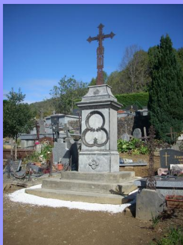
La croix rénovée au cimetière