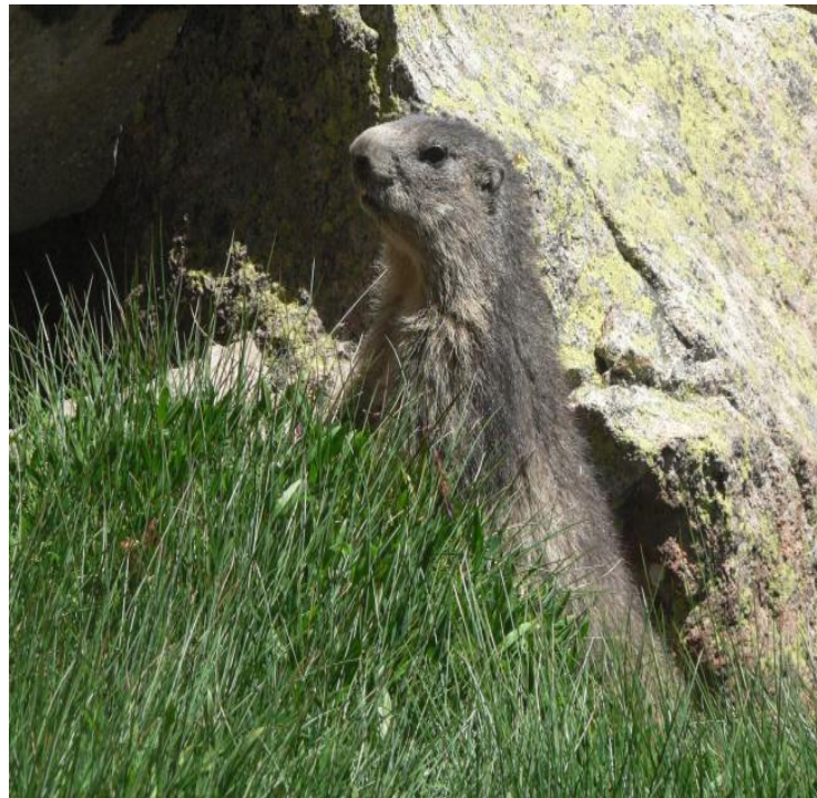
La Marmotte de bethmale