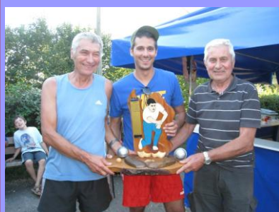
Les vainqueurs du concours de pétanque 2012