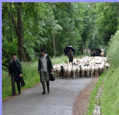
Transhumance en Bethmale