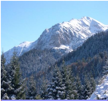
Le Balam enneigé