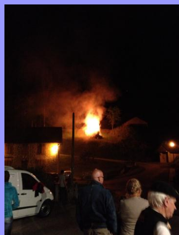
Feu de la Saint Jean