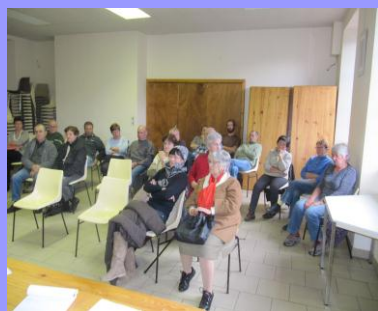
Quelques propriétaires avaient fait le déplacement A.G. de l'A.F.P. NOVEMBRE 2012

L'association de pêche « les Riverains du Balamet » vous souhaite de bonnes