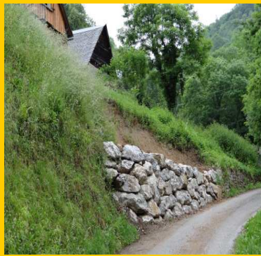
Enrochement sur le bas d'AYET