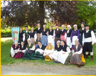
Groupe Espagnol Asturies « Alleran »