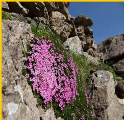
Silène des glaciers