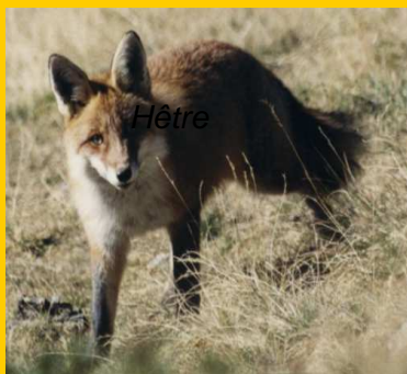
Un Renard à la croisée des chemins

Adresse du site : www.location-gite-salle-reception-ariège.com