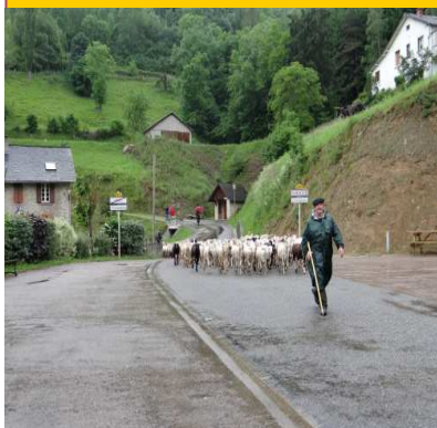
Passage des troupeaux à la mairie