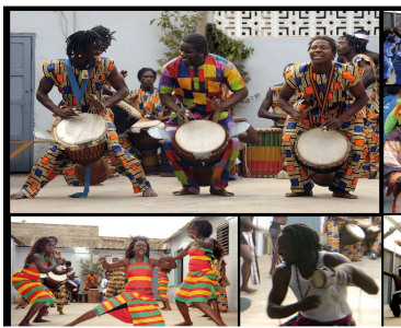
RITE 2012 Le Sénégal