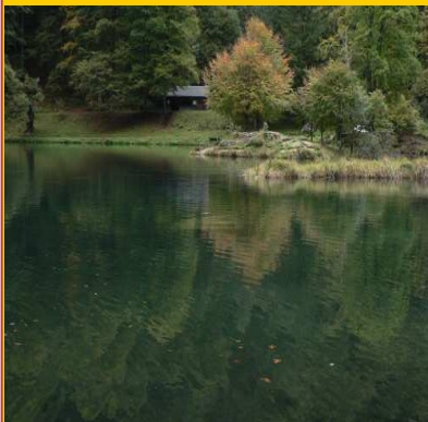
Lac de Bethmale