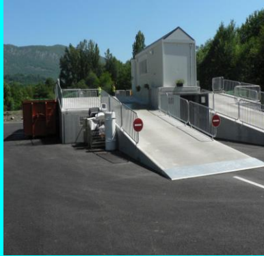
La plateforme de la déchetterie d'AUDRESSEIN

Le SDE souhaiterait connaître le N° de téléphone de chaque habitant pour les informer en cas de panne ou de mauvaise qualité de l'eau. S'inscrire en mairie 05.61.96.81.05. Merci.