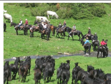
Beaucoup de monde ce 5 juin 2016