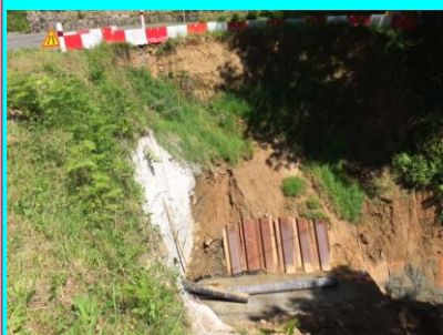
Travaux pont entrée Samortein