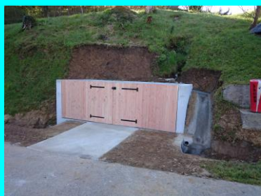
Nouveau parc à poubelles de Samortein