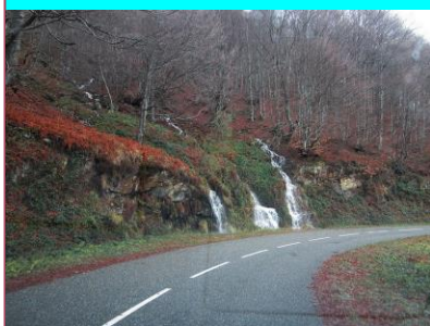
Après la pluie le beau temps