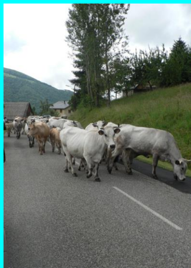
Les gasconnes en route vers les estives