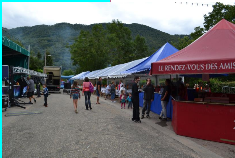
La fête 2015 sur la place entre les 2 villages : Samortein et Ayet