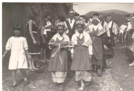
Autrefois à Bethmale, La fête du 15 août

La messe à l'église d'Ayet sera célébrée le samedi 15 août 2009