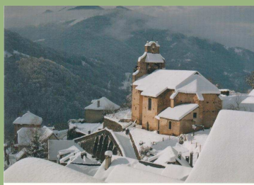
Eglise Ayet sous la neige