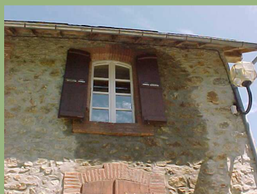
Dégât des eaux gîte et mairie fin 2007